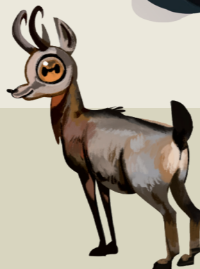
Sarrio Sarrioa Rupicapra pyrenaica