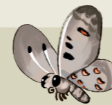
Mariposa apolo Apolo tximeleta Parnassius apollo

ESTE MATERIAL FORMA PARTE DEL PROYECTO PERIFER, INICIATIVA DE LA ASOCIACIÓN PAISATGES VIUS PARA LA CONSERVACIÓN DEL UROGALLO EN PIRINEOS PIRINIOTAN BASOILARRA KONTSERBATZEKO PAISATGES VIUS ELKARTEAK ABIATU DUEN PERIFER PROIEKTUKO MATERIALA.