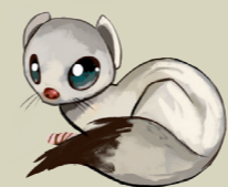
Armiño Erbinude zuria Mustela erminea