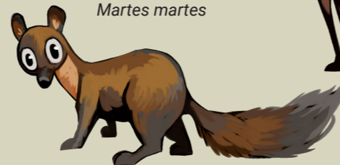
Marta Lepahoria Martes martes