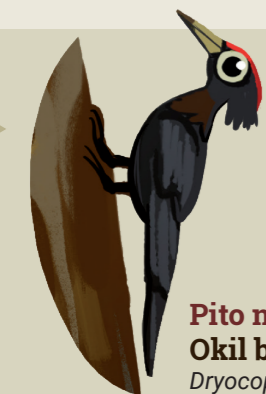
Pito negro Okil beltza Dryocopus martius

¡NECESITAMOS TRANQUILIDAD! RESPETA SIEMPRE LAS SENALIZACIONES DE "NO PASAR" LASAITASUNA BEHAR DUGU! ERRESPETA ITZAZU "EZ PASA" SEINALEAK