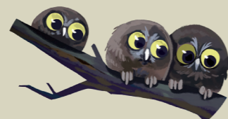
Mochuelo boreal Tengmalm-hontza Aegolius funereus